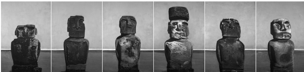
3. Les Statues de l'île de Pâques 1300 après J.-C. - 150 x 600 cm

Vidéo du musicien Pierre Hamon : cet ensemble monumental a inspiré une œuvre musicale originale au célèbre flûtiste, ami du peintre. Cette oeuvre de 9'56 est diffusée dans l'exposition.