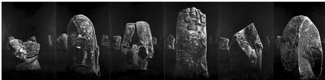
2. Les Stèles de Carnac 4500 ans avant J.-C. - 150 x 600 cm